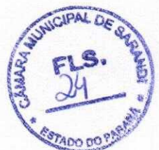
DALVECIR APARECIDO BONORA